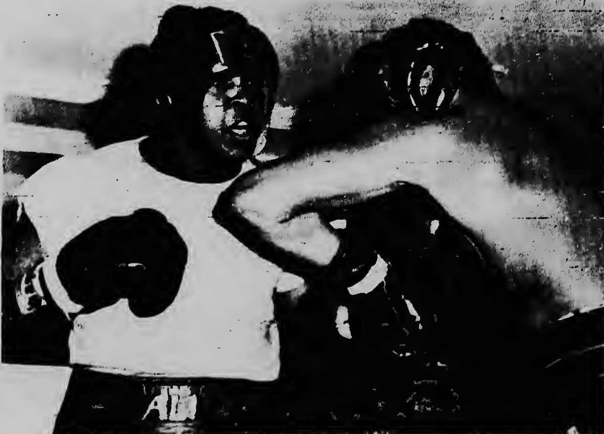
MIAMI BEACH -- Radiophoto UPI -- Cassius Clay ta train cuater round cu James Ellis na Miami den preparacion pa su defensa di e titulo contra Ernie Terrell dia 29 di maart. Clay a ser califica den e mihor grupo di boxdonan di heavyweight.

Bunker tabata casi permanentemente na Sto. Domingo foi september 1965, Penna Marinho i Clairmont a blaha cu frecuencia na sede di Union Panamericana i na nan paisnan, ma tambe nana pasa hopi tempu riba Sto. Domingo.